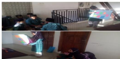
Gambar 4. Peserta didik sedang membuat review buku menggunakan teknik literasi / teknik review buku Fishbone dan teknik AIH.

Hasil dari terlaksananya program ini adalah, (1) anak-anak usia SD/MI-SMP dapat menjelaskan kembali ke teman-temannya informasi baru dari buku yang telah mereka baca, (2) meningkatnya minat baca anak usia SD/MI-SMP, dan (3) meningkat juga kepercayaan diri mereka berbicara di depan umum. Tidak ada faktor penghambat yang serius dalam melaksanakan program ini. Hanya saja dalam proses pelaksanaannya anak-anak yang berusia SD/MI sedikit berisik sehingga menyebabkan kondisi yang kurang kondusif saat mengerjakan review buku