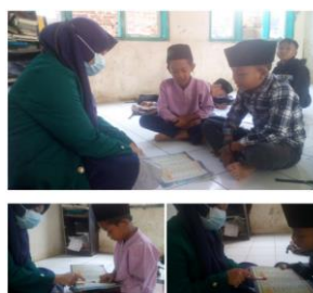
Gambar 1. Les membaca dengan sasaran peserta didik MI Banuraja.

Hasil dari terlaksananya program ini adalah siswa MI Banuraja jenjang kelas atas yang belum lancar membaca, yang menjadi sasaran program ini, mengalami peningkatan yang cukup signifikan dalam kemampuan membacanya. Hal ini dibuktikan dengan hasil penilaian setiap pertemuannya yang mengalami peningkatan.