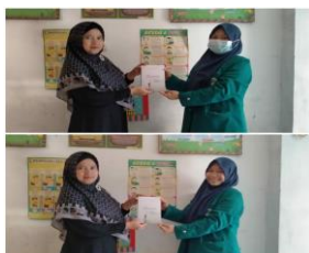
Gambar 5. Kunjungan dan donasi buku ke TBM Banuraja Yayasan Rif'at Taajul Ma'rifat.

Donasi buku terkendala oleh sedikitnya buku yang terkumpul serta waktu penggalangan buku dari donatur buku yang singkat, sehingga jumlah buku yang disumbangkan kepada TBM Banuraja terbatas.