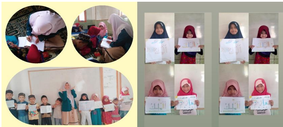
Gambar 4. Pendampingan dan Hasil Karya Anak

lain yang dilakukan adalah dengan meminta orangtua untuk selalu meminta anaknya agar selalu hadir.