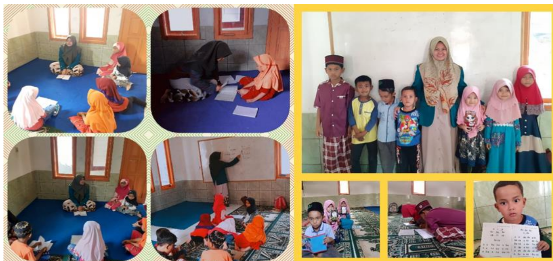
Gambar 3. Proses Penguatan Literasi Anak Usia Dini

Secara rinci, materi yang disampaikan pada kegiatan penguatan literasi anak usia dini pada Calistung dan BTQ adalah sebagai berikut: