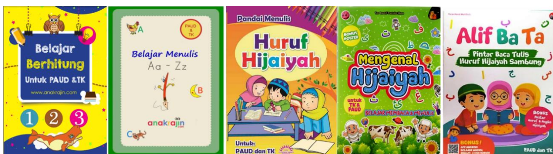
Gambar 2. Sumber Belajar Literasi Anak Usia Dini

Pada tahap awal kegiatan, analisis kebutuhan dilakukan untuk menentukan materi literasi yang akan disampaikan kepada anak usia dini di Desa Bunijaya Kecamatan Gununghalu. Hasil analisis kebutuhan diperoleh ada dua bentuk kebutuhan penguatan literasi pada anak usia dini, yakni Calistung dan BTQ. Dari dua materi tersebut, selanjutnya melakukan pengumpulan berbagai sumber belajar yang akan digunakan. Sumber belajar dikumpulkan dari berbagai internet dalam bentuk e-book , dan buku. E-book yang sudah dikumpulkan kemudian dipilih dan dicetak untuk nantinya dibagikan kepada peserta didik sesuai dengan materi yang telah ditentukan. Pada tahap ini juga, ditentukan jadwal dan materi pada setiap pertemuan, dari pertemuan pertama sampai pertemuan terakhir.